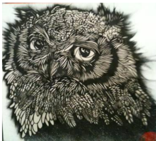
Monkey Bird, 2013

Monkey Bird : Né de l'association de deux jeunes artistes, Tmor et Blow, le Monkey Bird a pour ambition originelle de rendre aux murs anonymes des métropoles les spectres d'une nature animale, qu'elle engloutit par sa suprématie malade. Questionnant sur les notions de liberté et de propriété privée inaccessibles, leurs interventions illégales murmurent une philosophie anonyme par le biais d'images monumentales. Nourrissant leurs inspirations des gravures, des signes et calligraphies cosmopolites, le MBC est à la recherche d'un dialecte universel, étoffé de lignes méthodiques et de symboles redondants.